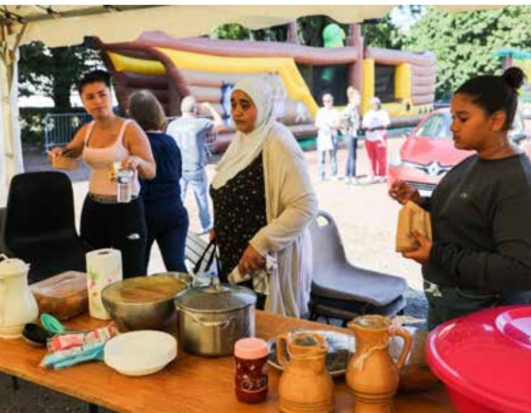
Fête de l'automne 2021