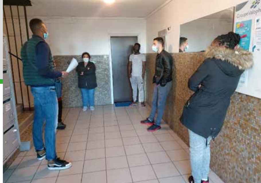
Réunions par hall