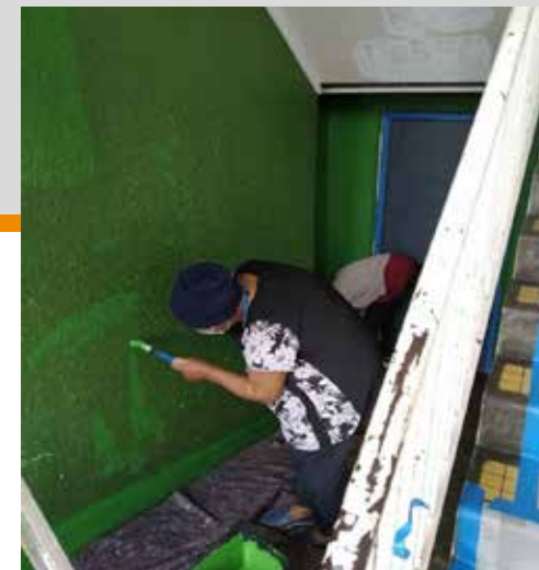
De gauche à droite : 1. 10 déc. 2021, visite avec des élèves de 6 e de Louise Michel. 2. 15 nov. 2021, intervention dans une classe de CM2 de Jean Jaurès. 3. Chantier collectif au 6 Grampa, résidence de la PAMA.

Pour le lot 2 (sensibilisation au cadre de vie et bien vivre-ensemble), Couleurs d’Avenir intervient sur :