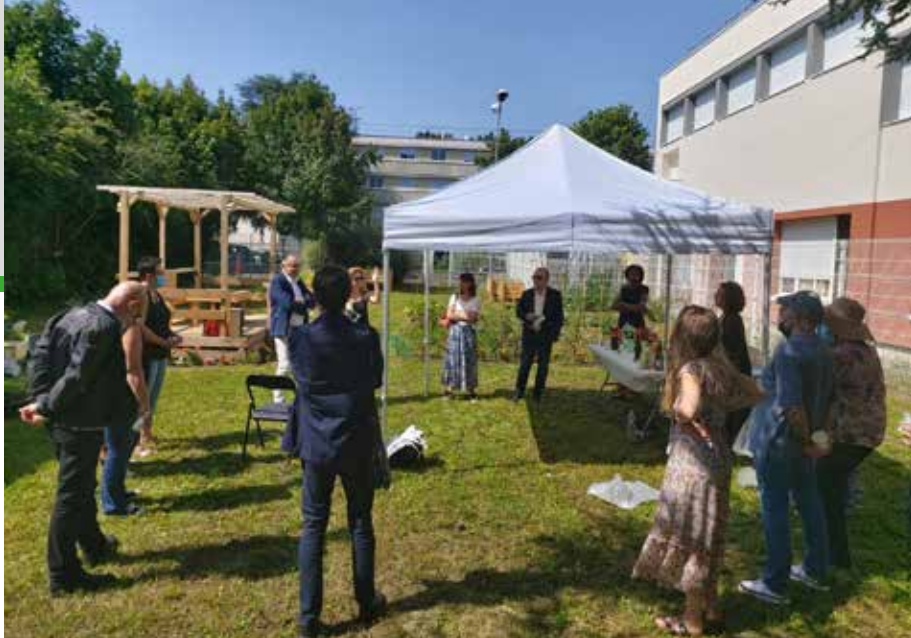
Inauguration du jardin d'Egly