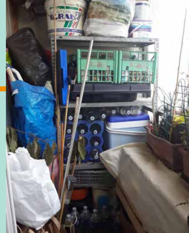
Avant et après