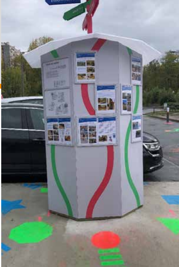
Totem signalétique, oct.2021