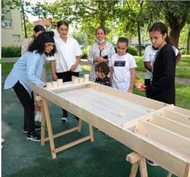
| Gérard Philipe